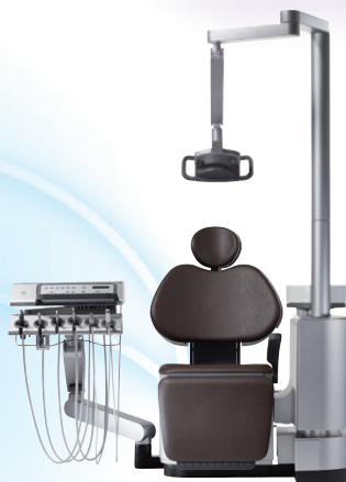
歯科用ユニット シグノ T500