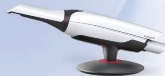
デジタル印象採得装置 TRIOS® 4