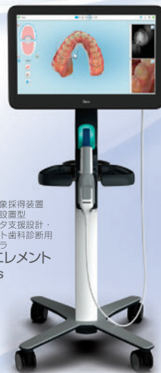
デジタル印象採得装置 歯科技工室設置型 コンピュータ支援設計・ 製造ユニット 口腔内カメラ iTero エレメント 5D Plus