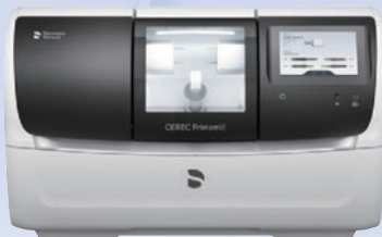
歯科技工室設置型コンピュータ支援設計・製造ユニット CEREC プライムミル

販売名 ベラビュー X800 一般名称 デジタル式歯科用パノラマ・断層撮影X線診断装置 医療機器の分類 管理医療機器(クラスII) 特定保守管理医療機器 医療機器認証番号 228ACBZX00008000 製造販売 株式会社モリタ製作所 販売名 ライカM320 12-D 4K 一般名称 可搬型手術用顕微鏡 医療機器の分類 一般医療機器(クラスI) 特定保守管理医療機器 医療機器届出番号 1382X10268320FDK 製造販売 ライカマイクロシステムズ株式会社 販売名 シグノ 一般名称 歯科用ユニット 医療機器の分類 管理医療機器(クラスII) 特定保守管理医療機器 医療機器認証番号 229AKBZX000081000 製造販売 株式会社モリタ製作所 販売名 アーウィンアドベール 一般名称 エルビウム・ヤグレーザ 医療機器承認番号 21500BZZ00720000 医療機器の分類 高度管理医療機器(クラスII) 特定保守管理医療機器 製造販売 株式会社モリタ製作所 販売名 セレックプライムスキャン AC 一般名称 チェアサイド型歯科用コンピュータ支援設計・製造ユニット 医療機器の分類 管理医療機器(クラスII) 特定保守管理医療機器 医療機器承認番号 300082X00044000 製造販売 デンツプライシロナ株式会社 東京都港区麻布台1-8-10 販売名 セレックプライムミル 一般名称 歯科技工室設置型コンピュータ支援設計・製造ユニット 医療機器の分類 クラスI 一般医療機器 医療機器届出番号 13B1X10226S10022 製造販売 デンツプライシロナ株式会社 東京都港区麻布台1-8-10 販売名 iTero エレメント 一般名称 デジタル印象採得装置(チェアサイド型歯科用コンピュータ支援設計・製造ユニット)(歯科技工室設置型コンピュータ支援設計・製造ユニット)(光学式ラゲージ装置) 医療機器の分類 管理医療機器(クラスII) 特定保守管理医療機器 医療機器承認番号 30200BZ100027000 選任製造販売 3Shape Japan合同会社 〒107-0052 東京都港区西麻布二丁目11-2 SHINKOH西麻布ビル 販売名 iTero エレメント 一般名称 デジタル印象採得装置 歯科技工室設置型コンピュータ支援設計・製造ユニット 歯科診断用口腔内カメラ 医療機器の分類 クラスII 特定保守管理医療機器 医療機器承認番号 22800BZX00222000 製造販売 インビザリオン・ジャパン株式会社