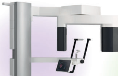
デジタル式歯科用パノラマ・断層撮影X線診断装置 ベラビュー X800