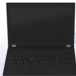
チェアサイド方歯科用コンピュータ支援設計製造ユニット プライムスキャンコネク