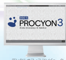
デンタルオフィスコンピュータ DOC-5 プロキオン 3