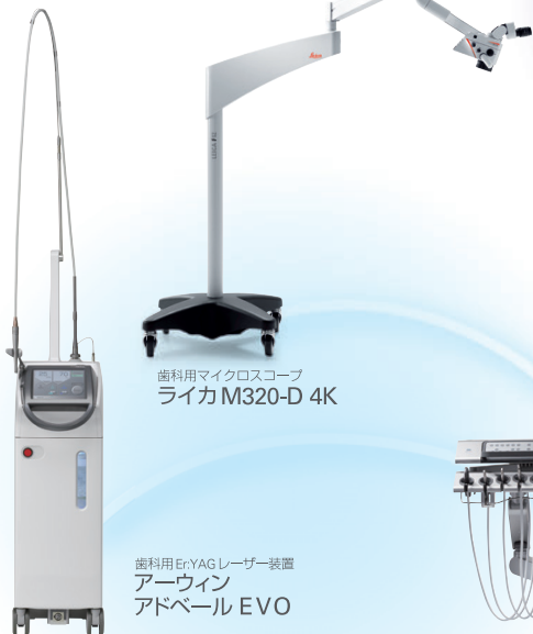
歯科用マイクロスコープ ライカM320-D 4K