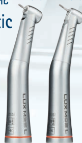
マスターマティック

一般的名称: ストレート・ギアードアングルハンドピース 管理医療機器・特定保守管理医療機器 医療機器認証番号:227AIBZX00026000