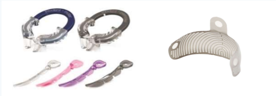
販売名:V4システム 一般的名称:歯科充填・修復材補助器具 届出番号:13B1X10236Y03920 クラス分類:Ⅰ(一般医療機器)