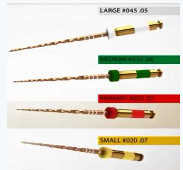
販売名:ウェーブワン ファイル 一般的名称:電動式歯科用ファイル 認証番号:224AGBZX00096000 クラス分類:Ⅱ(管理)