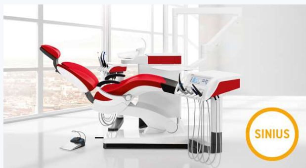
販売名:シロナ SINIUS 一般的名称:歯科用ユニット 認証番号:224AABZI0006500 クラス分類:II (管理・特管・設置)