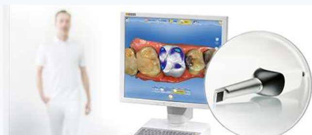
販売名:セレックAC オムニカム 一般的名称:チェアサイド型歯科用コンピュータ支援設計・製造ユニット 認証番号:22200BZI00012000 クラス分類:II (管理・特管・設置) 販売名:セレックMC XL 一般的名称:歯科技工室設置型コンピュータ支援設計・製造ユニット 届出番号:13B1X10118000002 クラス分類:II (管理・特管・設置)