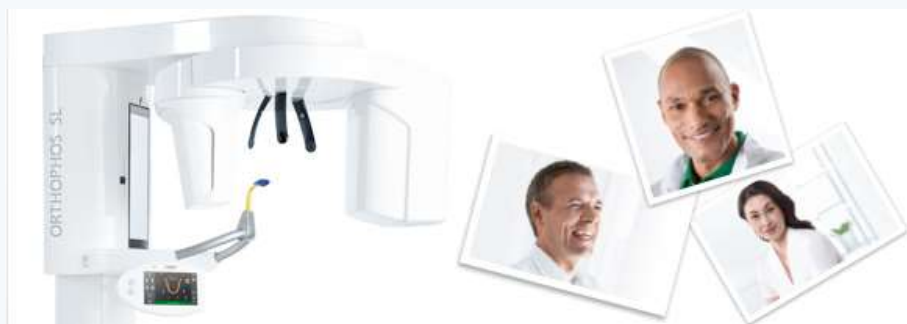
販売名:オーソフォスSL 一般的名称:アーム型X線CT診断装置 認証番号:227AABZI00109000 クラス分類:II (管理・特管・設置)