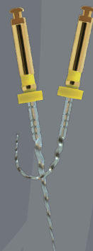
一般的名称：電動式歯科用ファイル 認証番号：301ALBZX00015000 (管理)