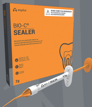
一般的名称：水酸化カルシウム系歯科根管充填材料 承認番号：30200BZX00263000 (高度)

1993年 神奈川歯科大学卒業 2006年 ペンシルバニア大学大学院 歯内療法学科卒業 2009年 ペンシルベニア大学非常勤講師 2007年 歯内療法専門医院開設(東京) AAE specialist member 日本歯内療法学会 専門医 石井歯内療法研修会 主宰 ペンエンドスタディークラブインジャパン 主宰