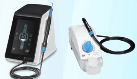
マグネット式超音波スケーラー「キャビトロン」