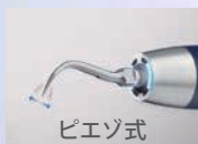
ピエゾ式 直線振動