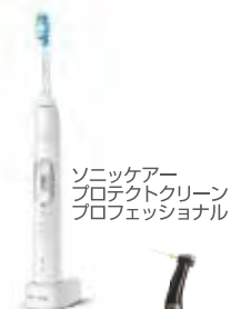
ソニッケーア プロテクトクリーン プロフェッショナル