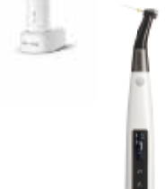
歯科多目的治療用モータ トライオート ZX2