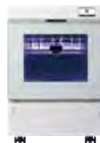
器具除染用洗浄器 IC-Washer