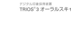
デジタル印象採得装置 TRIOS® 3 オーラルスキャナ