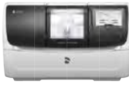
歯科技工室設置型コンピュータ 支援設計・製造ユニット セレック プライミル