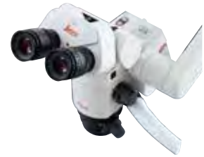
歯科用顕微鏡 ライカ M320-D 4K タイプ