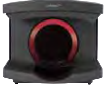
歯科技工室設置型コンピュータ 支援設計・製造ユニット カタナ® デンタルスキャナー E1