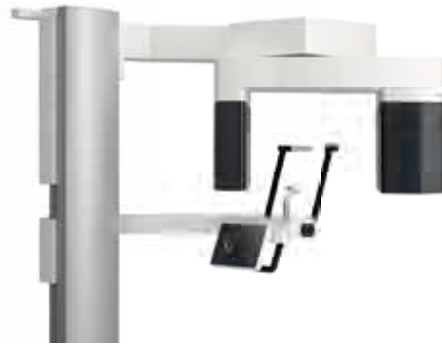
デジタル式歯科用パノラマ・断層撮影X線診断装置 ベラビュー X800