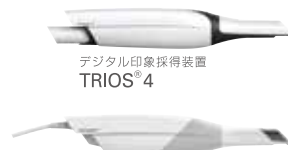
デジタル印象採得装置 TRIOS® 4