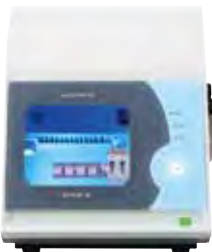
歯科技工室設置型コンピュータ 支援設計・製造ユニット 歯科用CAD/CAMマシン DWX-4