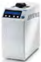
メラクイック 12+ 認証番号 225AKBZX00142000