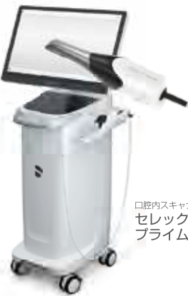
口腔内スキャナ セレック プライムスキャン