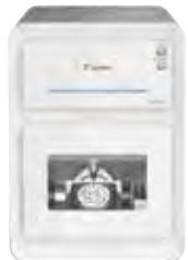
歯科技工室設置型コンピュータ 支援設計・製造ユニット 歯科用ミリングマシン MD-500