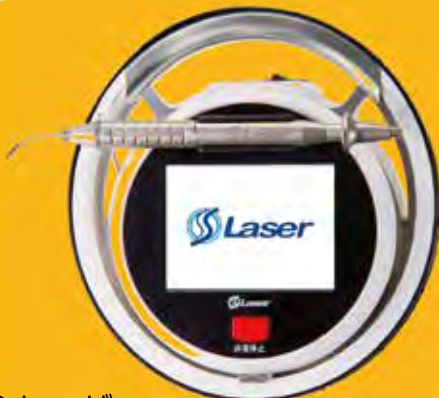
Sレーザー 承認番号 23000BZX00022000