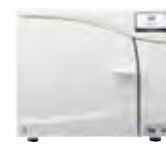
小型包装品用高圧蒸気滅菌器 IC Clave