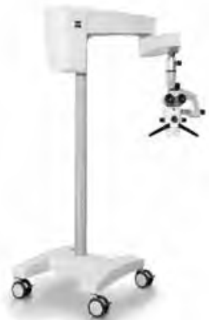
EXTARO300 届出番号 13B1X00119003570