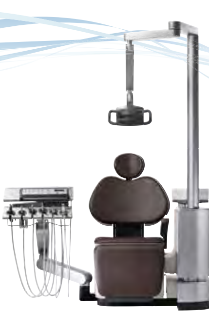
歯科用ユニット シグノ T500