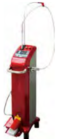
ガスレーザー Plus 承認番号 23000BZX00030000