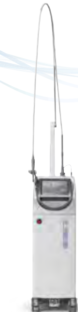
歯科用Er:YAGレーザー装置 アーウィン アドベール EVO