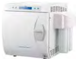
バキュークレーブ 31B+ 認証番号 223AKBZX00237000